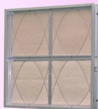
●塩害対策仕様も対応可能です。

フィロシステム VT.CE は、共板フランジタイプのサイドメンテナンス方式のケーシングです。